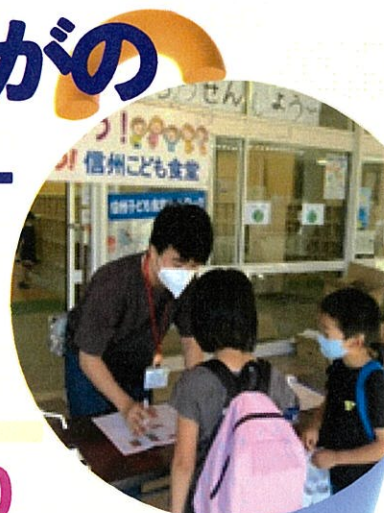
※長野商業高校JRC部（写真）