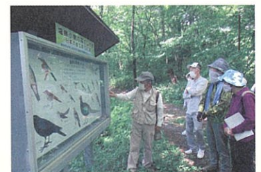
校外に出てフィールドワーク

シニア大学では、近隣や市町村の枠を超えた新たな仲間づくりや学生自らの自主的な活動を促進するため、少人数に分けて班活動を行います。班編成は入学時に学部において行います。