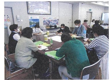
グループワークで意見交換