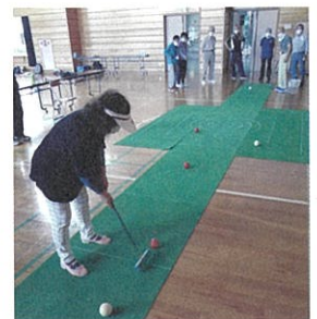
ニュースポーツで健康づくり