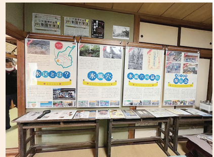
氷風穴史料館は多くの資料があり見応えがあります

氷風穴は、 歴史・地質・植物 など、 様々な学びの場 となっています。区民や関係者の協力のもと、各分野の資料を集め、展示できる場所を探していたところ、布引温泉こもろのご厚意で、敷地内の建物を貸してもらったことになりました。昨年11月に「 氷風穴史料館 」を開設し、多くの