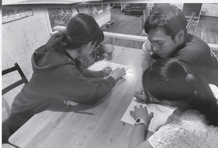
学習支援「学びと夢のエール」

【学習支援】 「ヤングケアラーや不登校の子ども達が安心して勉強できる場をつくりたい」という思いから、市内の子育て支援団体や学習塾と協力し、令和8年1月に学習支援「学びと夢のエール」を始めました。現在、小中学生7名程が参加しています。また、